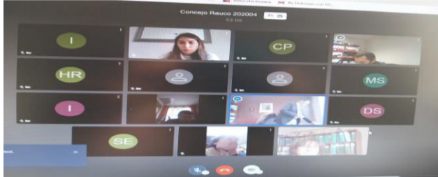
TABLA DEL CONCEJO

Se destaca que esta acta es un extracto de la reunión y que además se cuenta con audio de la sesión