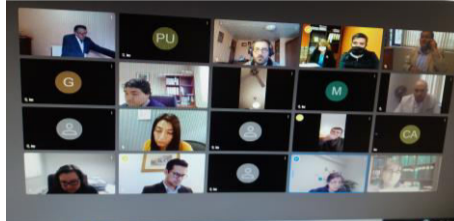
TABLA DEL CONCEJO

Se destaca que esta acta es un extracto de la reunión y que además se cuenta con audio de la sesión.